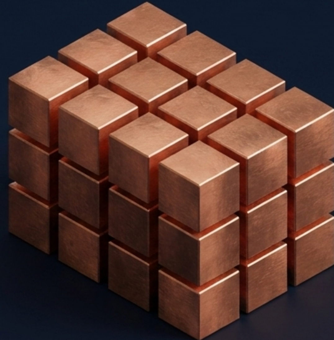
Distribución expandida (Tiempo Parcial II)