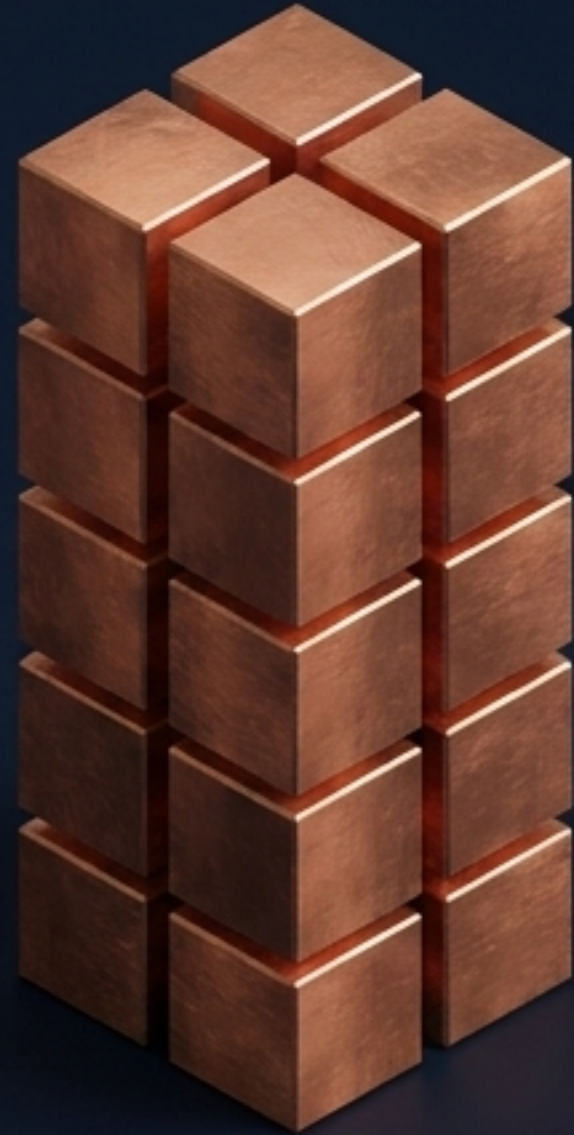
Alta compresión de tiempo (Tiempo Completo)

Cambiar de ritmo distribuye el tiempo, pero nunca altera los créditos ECTS ni la sustancia académica. No falta ninguna pieza.